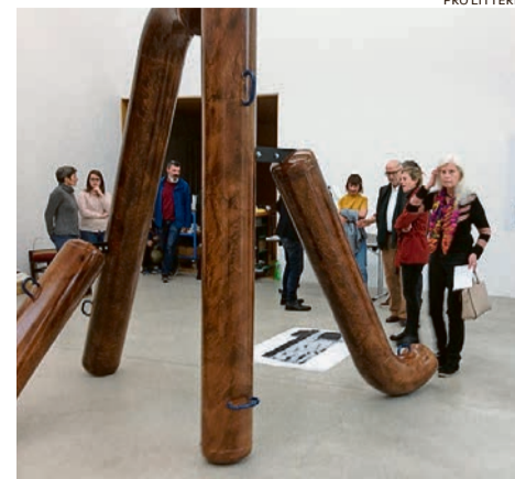
Eine Skulptur wie ein Turngerät.