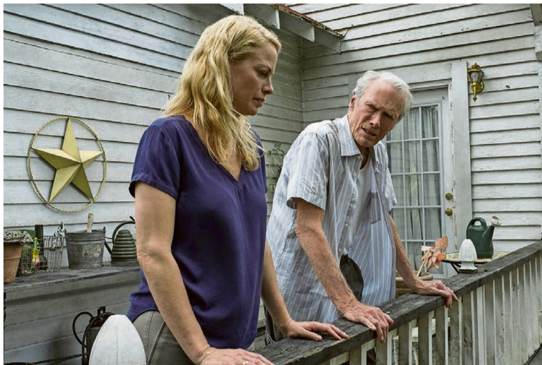
Privat wie im Film als Tochter und Vater eng verbunden: Alison und Clint Eastwood.