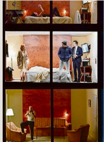
Das «Hotel Strindberg» bietet am Theater Basel Einblick in moderne Liebesdramen.

Simon Stone sorgt in seiner Geburtsstadt Basel für einen unterhaltsamen, teilweise sehr lustigen Theaterabend. Abermals präsentiert er uns ein Haus als Bühnenbild, diesmal ein Hotel, bei dem wir in sechs Zimmer gucken. Das stimuliert Voyeurismus, umso mehr, als es um Liebesdramen und Seitensprünge geht. Faszinierend ist, wie Stone die Stränge verwebt. Am intensivsten ist der zweite Akt, herausragend Martin Wuttke als Cineast, der sich mit seiner Gattin zofft. Moderne Beziehungen sind oft zum Scheitern verurteilt, so die Botschaft. Man hätte sie an dem viereinhalbstündigen Theaterabend auch nach drei Stunden kapiert. (cj.)